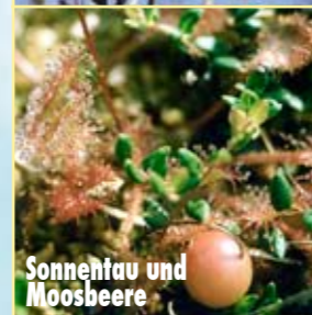
Sonnenblau und Moosbeere