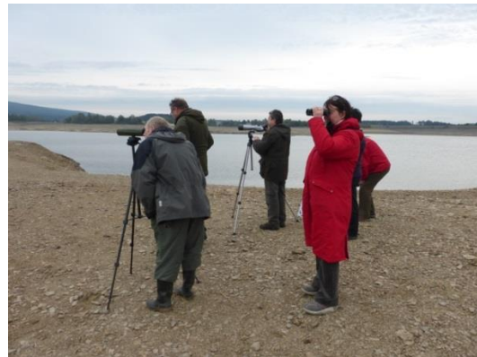
„Bird Watching“ 2013 am Förmitzspeicher

Im Rahmen des „Bird Watching Day“ besuchte die LBV-Kreisgruppe am 05.10.2013 den „Förmitzspeicher“ im Nachbar-Landkreis Hof. Der Wasserspiegel dieses Stausees war stark abgesenkt. Leider war die „Ausbeute“ der beobachteten Vogelarten relativ gering. Neben ca. 130 Kanadagänsen und ebenso vielen Stockenten konnten einige Rabenkrähen, ein Kolkkrabe, eine Streifengans, ein Graureiher, ein Zwergtaucher sowie 4 Alpenstrandläufer erfasst werden.