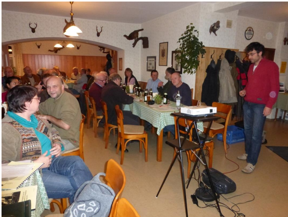
Vortragsabend „Ökologische Neuigkeiten“ am Buß- und Betttag 20.11.2013