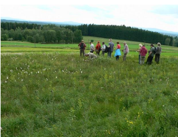
Basenreiche Nasswiesen am Wartberg-Südwestfuß