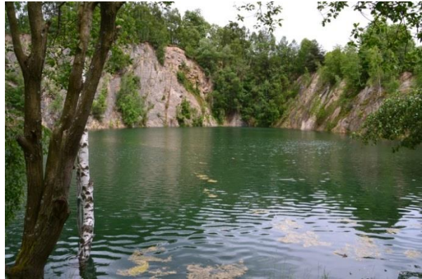
Südlicher Steinbruch am Wartberg