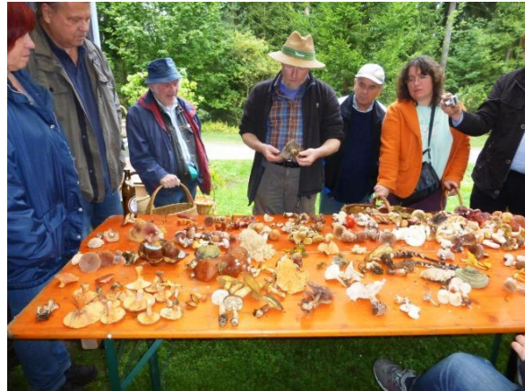
Pilzexkursion mit Besprechung, Bibersberg bei Marktleuthen

Im Rahmen des „Bird Watching Day“ besuchte die LBV-Kreisgruppe am 05.10.2013 den „Förmitzspeicher“ im Nachbar-Landkreis Hof. Der Wasserspiegel dieses Stausees war stark abgesenkt. Leider war die „Ausbeute“ der beobachteten Vogelarten relativ gering. Neben ca. 130 Kanadagänsen und ebenso vielen Stockenten konnten einige Rabenkrähen, ein Kolkkrabe, eine Streifengans, ein Graureiher, ein Zwergtaucher sowie 4 Alpenstrandläufer erfasst werden.