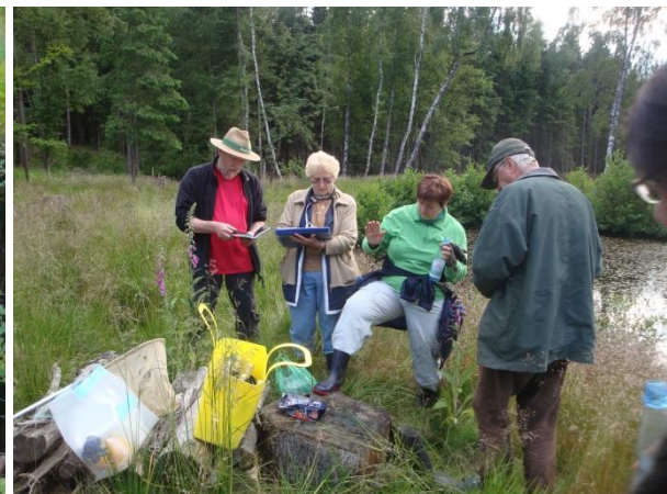
Pause nach getaner Arbeit