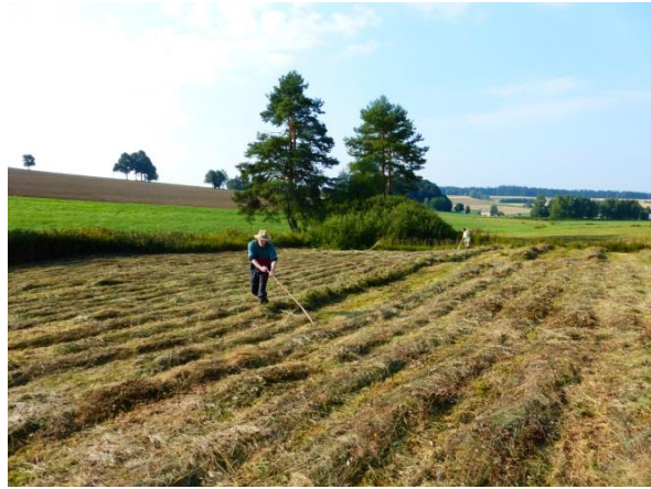
Biotoppflege 2013, LBV-Kalkflachmoor bei Selb-Oberweißenbach