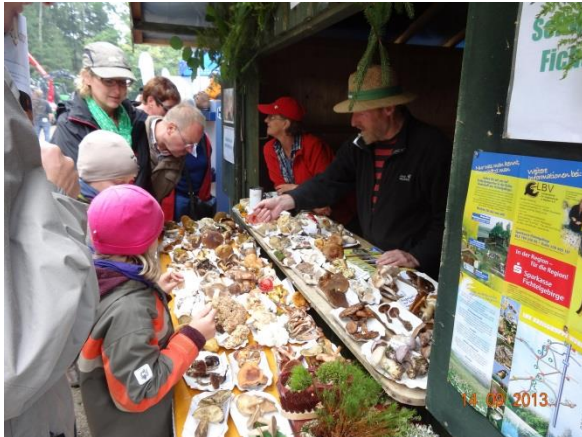
Pilzausstellung am LBV-Stand, „Sechsjämterland-Holztage“

melt worden. Der LBV-Stand war wegen des großen Interesses am Thema „Schwammer“ ein echter Publikumsmagnet. Dementsprechend hoch war der Einsatz der Standbetreuer.